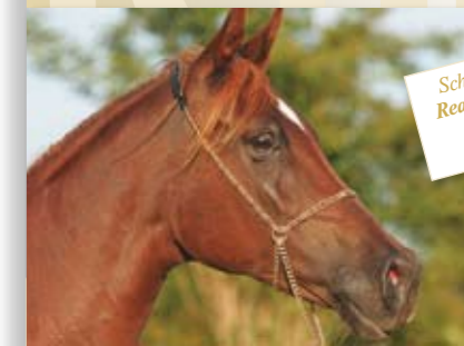
Schauhalfter Reality Dream Classic 429,- €