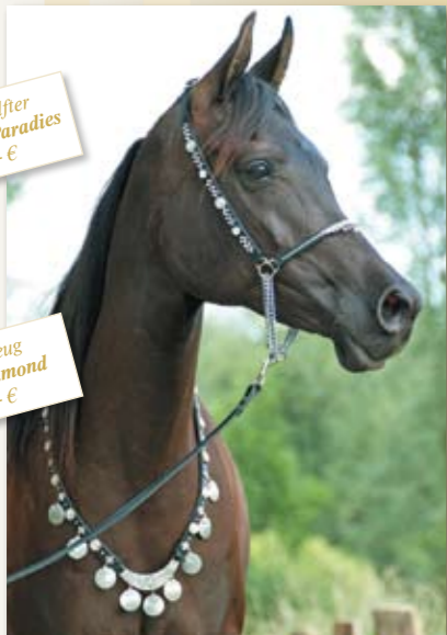
Vorderzeug Titan Diamond 249,- €