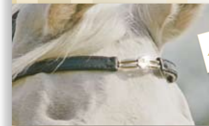
Stirnband Animal Style 39,- €