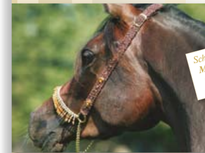
Schauhalfter Makramee Colorado 229,- €