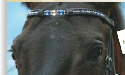
Stirnband Blue Dreams 169,- €