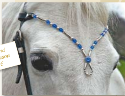
Stirnband Blue Season 79,- €