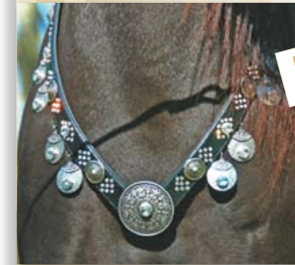
Vorderzeug Imperial 598,- €