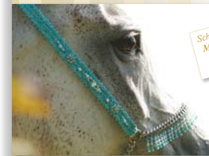
Schauhalfter Makramee Pacific 229,- €